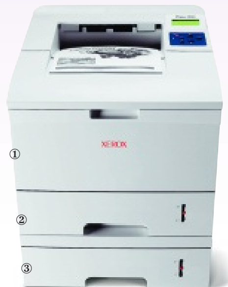
La stampante Phaser 3500 con l'alimentatore opzionale da 500 fogli