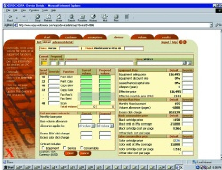
Pagina XOPA del costo dettagliato dei dispositivi - Esempio